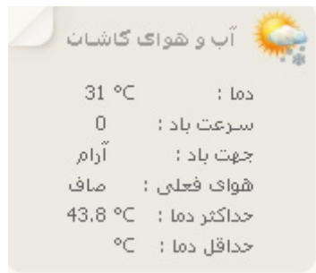
تصویر شماره ۷: وضعیت آب و هوای کاشان و مشخصات کامل وضعیت جوی کاشان