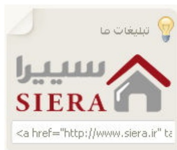
تصویر شماره ۸: لوگوی تبلیغاتی سامانه سییرا

در این بخش دوستان و کاربرانی که خواهان تبادل لینک با سامانه سییرا هستند می توانند کد HTML مربوط به لوگوی تبلیغاتی سایت را در قسمت مربوط به سایت و یا وبلاگ خود قرار دهند. این دسته از دوستان بعد از قرار دادن لوگوی سایت سییرا در سایت یا وبلاگ خود می توانند با استفاده از بخش ارتباط با ما مدیران سایت را آگاه کرده تا لینک سایت و یا وبلاگ آنها در قسمت پیوندهای سایت سییرا قرار بگیرد.